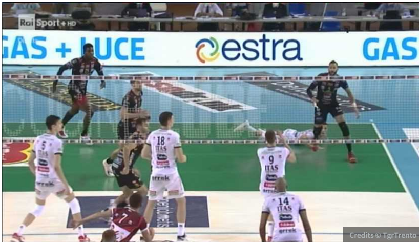
Un momento della partita

Nella semifinale di ritorno la Trentino Volley ha perso contro i padroni di casa della Cucine Lube Civitanova al Golden Set