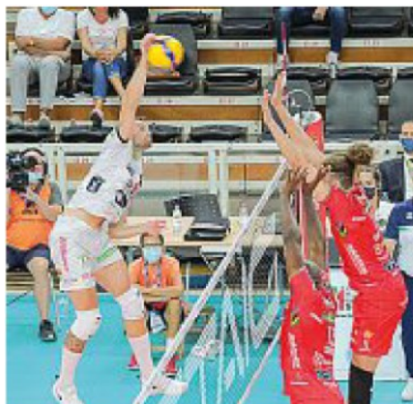
Duello Itas e Civitanova lotteranno per tutti i traguardi quest'anno (Pretto)